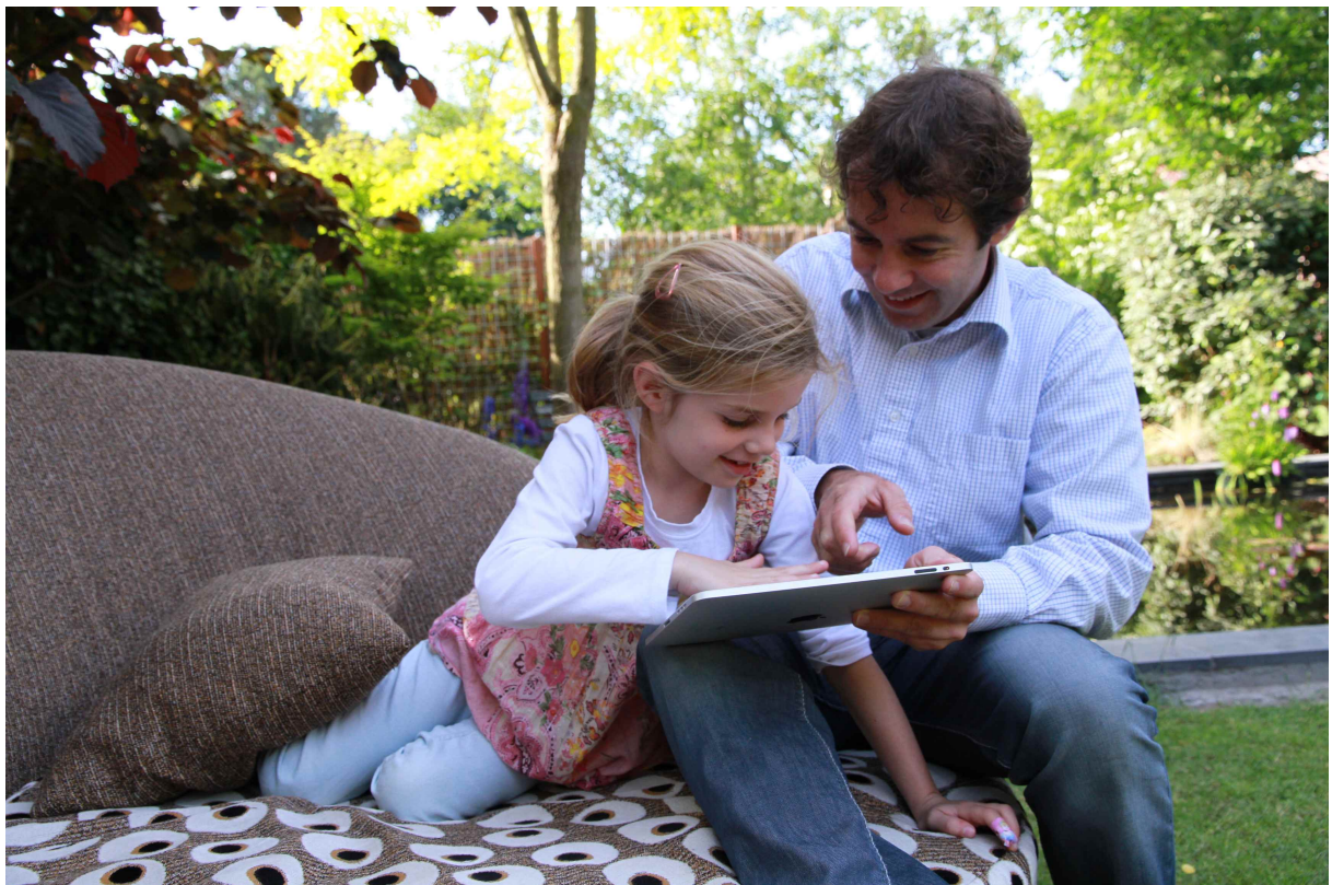
Persafbeeldingen Prinses Arabella wil spelen 2

http://www.rumdeedum.com/media/persbericht1/prinses-arabella-wil-spelen5.jpg