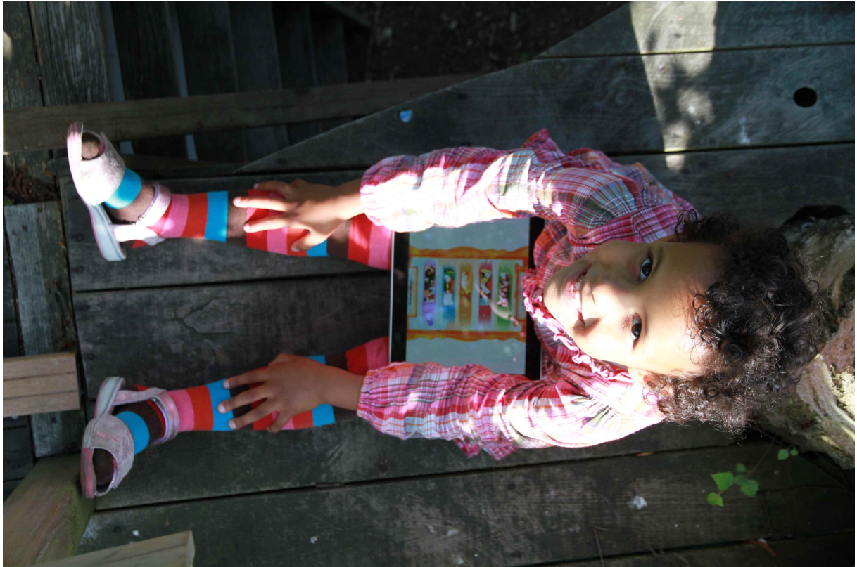
Persafbeeldingen Prinses Arabella wil spelen 5

http://www.rumdeedum.com/media/persbericht1/prinses-arabella-wil-spelen5.jpg